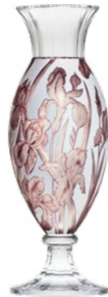
váza / Komtesa ryt. Kosatce křišťál přejímaný ametystem a bílým emailem 12,3 x 38 cm 3460 limitovaná série / 30 ks