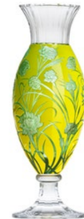
váza Komtesa ryt. Dáma s karafiáty křišťál přejímáný zelenou a žlutým emailem 16,4 × 50 cm 3460 limitovaná série / 15 ks