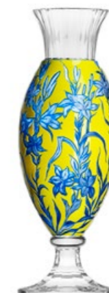
váza / Komtesa ryt. Lilie křišťál přejímaný modrou a žlutým emailem 12,3 × 38 cm 3460 limitovaná série / 30 ks