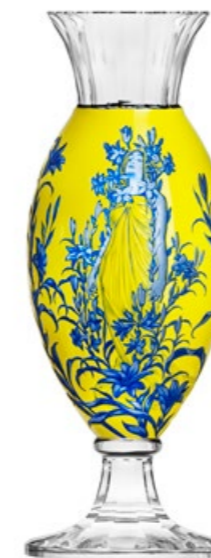
váza / Komtesa ryt. Dáma s liliemi křišťál přejímaný modrou a žlutým emailem 16,4 × 50 cm 3460 limitovaná série / 15 ks