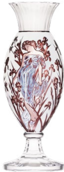
váza / Komtesa ryt. Dáma s kosatci křišťál přejímaný ametystem a bílým emailem 16,4 x 50 cm 3460 limitovaná série / 15 ks

Povšimněte si efektu stínování. Odehrává se v první vrstvě přejímaných barev. Rytý květinový motiv obklopuje vázu kolem dokola, aby světlo mohlo vstoupit dovnitř. Hlava ženy, ruce, tělo i nohy jsou proryté, šaty jsou téměř průhledné, nedotčený email (neprůhledná barva) vyplňuje nerytou plochu a dodává dílu zajímavý kontrast. Vrchní část je ručně broušena až na podkladový čirý křišťál a spodní část je již čirý broušený křišťál.