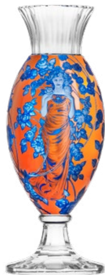
váza / Komtesa ryt. Dáma s růžemi křišťál přejímaný modrou a oranžovým emaillem 16,4 x 50 cm 3460 limitovaná série / 15 ks

Barevné kombinace menších váz stejného typu byly mistry skláři vyzkoušeny vůbec poprvé. Netradiční jasné barvy a jejich kombinace pomohly vytvořit odstíny podobné Muchovým originálním kresbám. Květiny získaly díky hodinám ručního broušení a rytí plastický charakter a i bez živých květin budou bezesporu ozdobou interiéru.