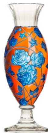
váza / Komtesa ryt. Růže křišťál přejímaný modrou a oranžovým emaillem 12,3 x 38 cm 3460 limitovaná série / 30 ks